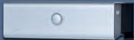
SOLUTION 501 MONOAMPLIFIER