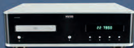
HANSS ACOUSTICS CD-20