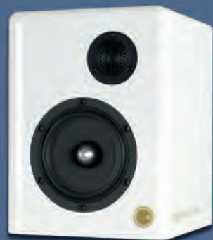
CARE ORCHESTRA DIVINA MINOR