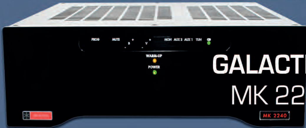
GALACTRON MK 2240