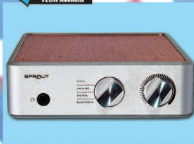
PS AUDIO SPROUT