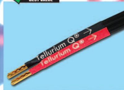
TELLURIUM Q BLACK II

BLU PRESS FDS - #03 - ISSN 1121-5313 80267 MENSILE dal 1991 MAR 18 6,50 € Prima Immissione 10-09-2018 9 771121 531001