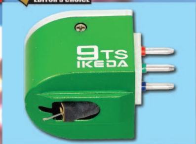
IKEDA 9 TS